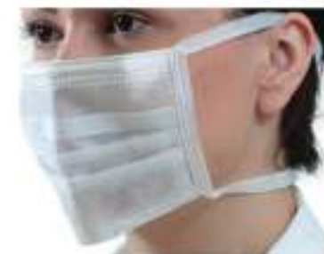
MÁSCARA DESCARTÁVEL TRIPLA COM TIRAS E CLIP NASAL

MATERIAL: TECIDO NÃO TECIDO (TNT) PARA USO ODONTOLÓGICO-MÉDICO-HOSPITALAR