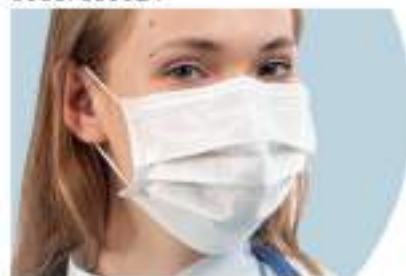
MÁSCARA DESCARTÁVEL TRIPLA COM ELÁSTICO E CLIP NASAL